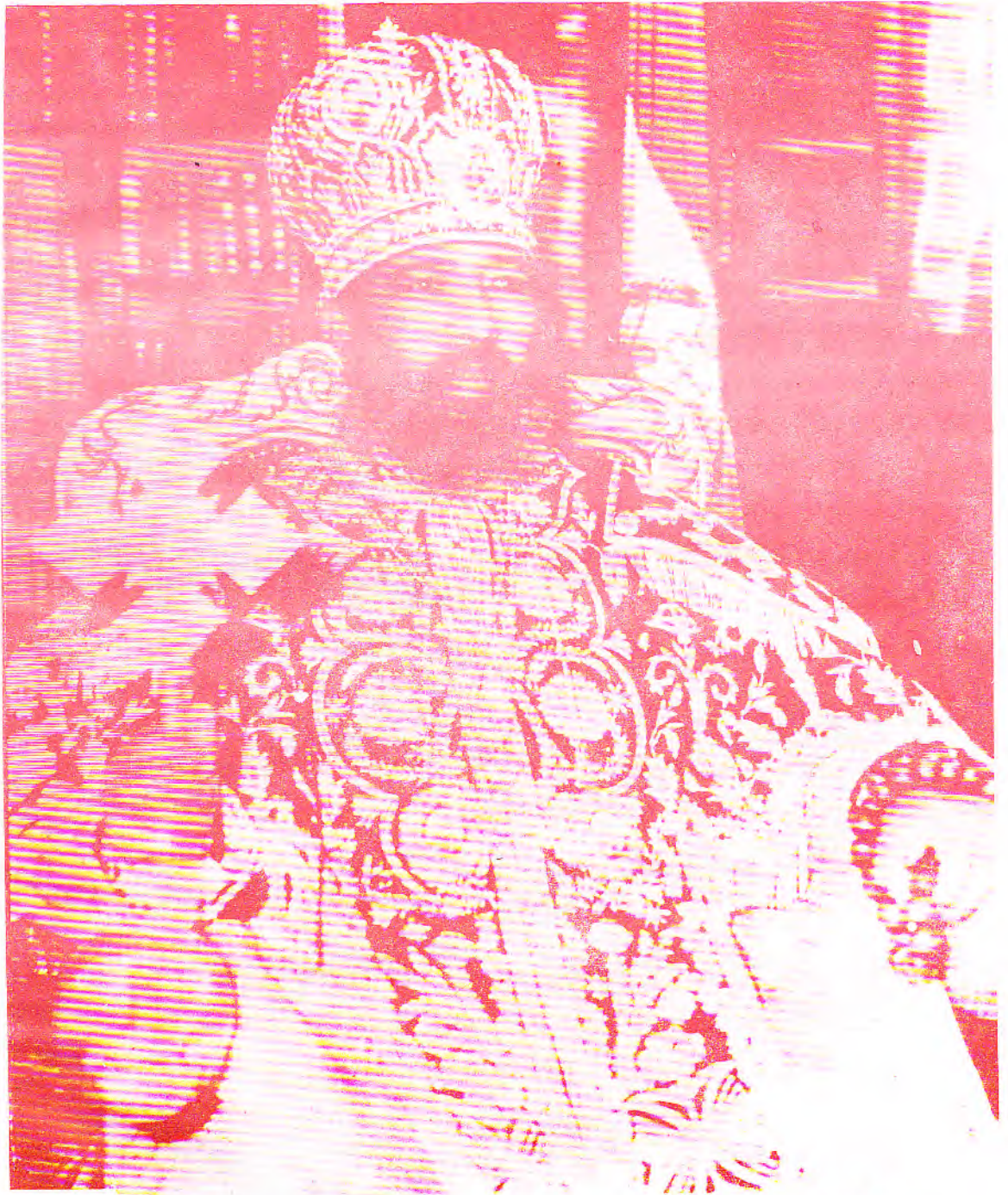
ብፁዕ ወቅዱስ አቡነ ጳውሎስ ፓትርያርክ ርእሰ ሊቃነ ጳጳሳት ዘኢትዮጵያ ሊቀ ጳጳስ ዘአክሱም ወእጩ ዘመንበረ ተክለ ሃይማኖት